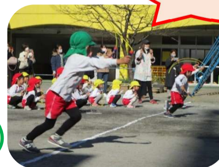
なわとびリレー 絶対に負けないぞ！