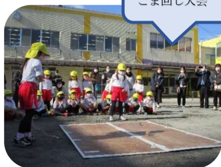
予選を勝ち抜いて決勝戦！ コマ回し大会

なお、年少保護者参観会を2月24日（水）に、年中保護者参観会を3月1日（月）に実施する予定です。