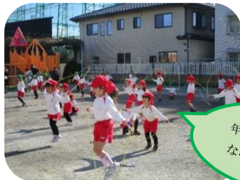
年長全員で なわとび選手権！