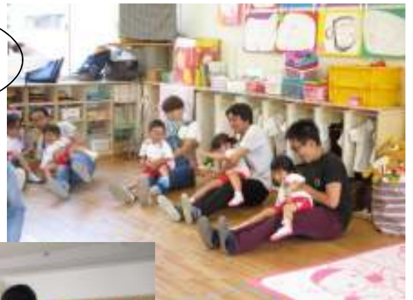
あのは〜しが お〜ちるま〜え〜に♪