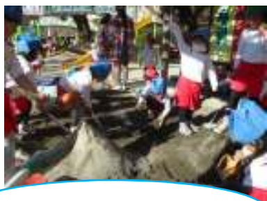
みんなで山づくり~!

年少 2学期、いろいろな所に園外保育・遠足に出掛けたり、様々な行事や日々の生活を通して、園生活を楽しんできた子ども達。その中で、「友達と一緒にだと楽しい!」「友達大好き♡」という思いがどんどん強くなり、お互いに誘い合っておうちごっこやお店屋さんごっこをしたり、おにごっこやかくれんぼ等を楽しむ姿がみられるようになりました。一緒に遊んでいると、「私はこうしたかったのに!」「僕はそれじゃイヤ!」とトラブルになる事もしばしばありますが、それも、安心して自分の思いを出せるようになってきた証拠です。それと同時に“相手にも気持ちがある”“みんなで楽しく遊ぶためにルールを守る”という事を知りました。しかし、まだまだうまく言葉で言えず、泣いて訴えたり、思わず手が出てしまう事もあるので、教師が間に入り、お互いの思いを代弁したり、言葉で伝えるよう促し、一緒に解決できるようにしています。