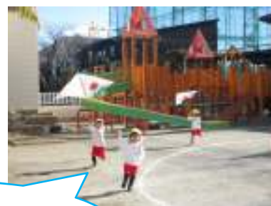
たか~く あがれ! 1月のたこあげ楽しみ~

毎日少しずつ逞しくなっていく子ども達!これからも、一人ひとりの力を出し切れるように援助していきたいと思えます。